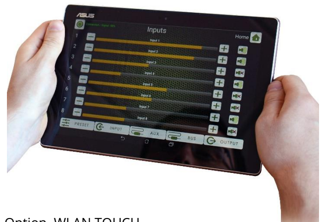
Option WLAN TOUCH

Bei den digitalen Prozessoren SDM 100/200 dreht sich alles um Audio Performance. Designed und engineered in Deutschland. Durch seinen modularen Aufbau können die Anzahl der Ein-/Ausgangskanäle, die Steuerbarkeit und die Anbindung an digitale Audionetzwerke wie DANTE und AVB je nach Anforderung optimal konzipiert werden. Die integrierte Mehrfach-Lautsprecherendstufe vervollständigt die ALL IN ONE Konzeption.